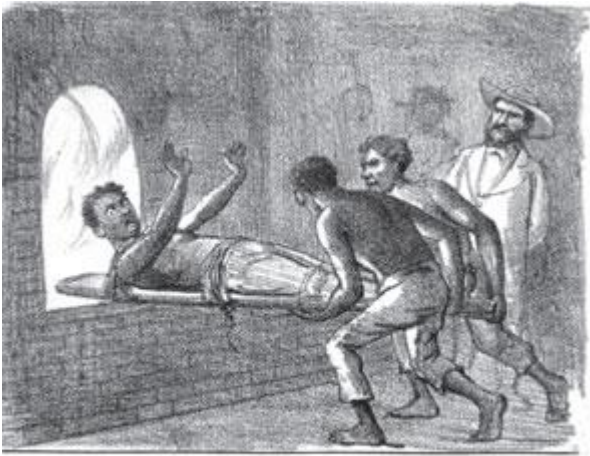
Contam-se horrores sobre as atrocidades dos Barbáricos senhores. Escravos têm sido metidos vivos em fornos incandescentes.

A essa altura, a libertação total dos escravos já era uma possibilidade real. A perda de legitimidade da escravidão acentuava-se especialmente nas grandes cidades. A reação vinha de setores da oligarquia cafeeira, temerosos de um solavanco nos negócios com a previsão de perda de seu "capital humano" da noite para o dia. Como as evasões tornavam-se frequentes, aumentou a repressão contra escravos fugidos em vários municípios da província do Rio de Janeiro.