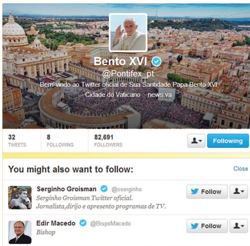
Figura 2 - Sugestões de perfis semelhantes ao @Pontifex, como Serginho Groisman e Edir Macedo

Por outro lado, como máxima autoridade da Igreja – sendo um fortíssimo hub (ou conector) de interações na grande rede –, ao entrar na rede de microblogging, Bento XVI se somou aos cálculos da plataforma como um perfil a mais. Ao passar a seguir a conta @Pontifex, a plataforma indicava ao usuário-seguidor outras contas semelhantes que poderiam ser de seu interesse. Para chegar a esses resultados cruzados, o Twitter realiza uma complexa combinação de dados do perfil do usuário-seguidor e do perfil do usuário seguido, neste caso o @Pontifex. Em alguns casos, o resultado do cruzamento de dados chamava a atenção (FIG. 2).