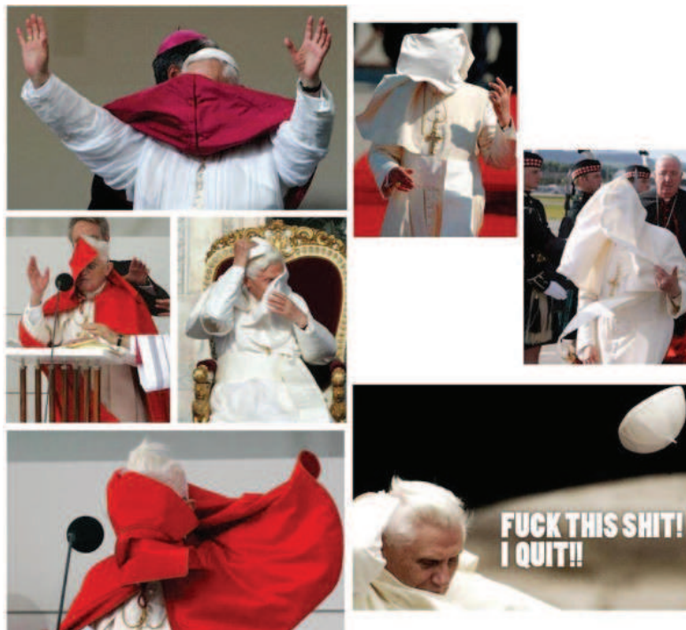
Figura 6 - “Foda-se! Eu saio!”