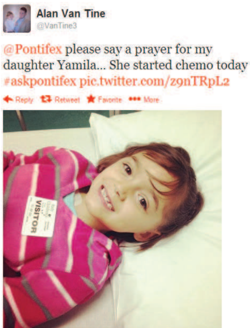
Figura 1 - Uso da hashtag #askpontifex no Twitter