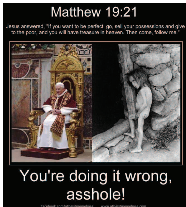
Figura 5 - “Mateus 19:21. Jesus respondeu: ‘Se você quer ser perfeito, vá, venda tudo o que tem, dê o dinheiro aos pobres, e você terá um tesouro no céu. Depois venha, e siga-me’.

Você está fazendo isso errado, estúpido!”