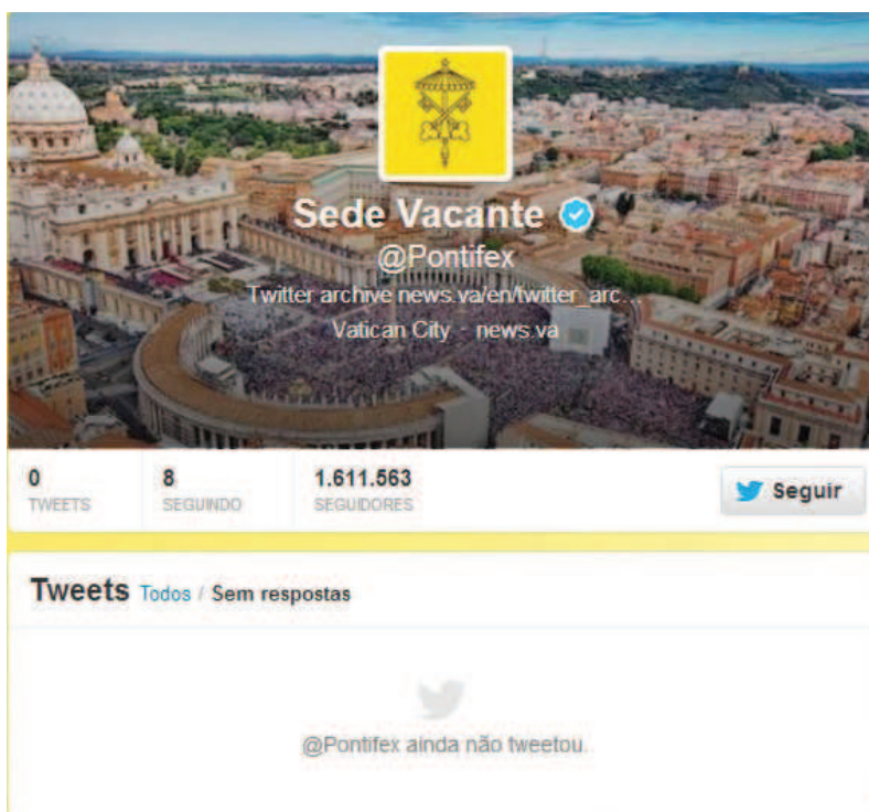
Figura 3 - Conta @Pontifex após saída de Bento XVI do papado

Após sua renúncia no dia 11/02/2013 e o fim do papado de Bento XVI oficialmente no dia 28/02/2013, iniciava-se o chamado período de sede vacante, quando o trono papal está vazio. Coube à Santa Sé reconstruir simbolicamente essa “ausência digital” do papa na plataforma do Twitter (FIG. 3).